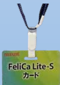
穴開け加工カード