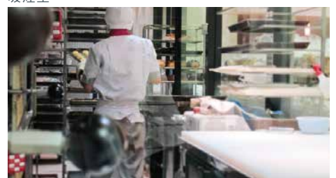
餐廳、料理設施、食堂的廚房等