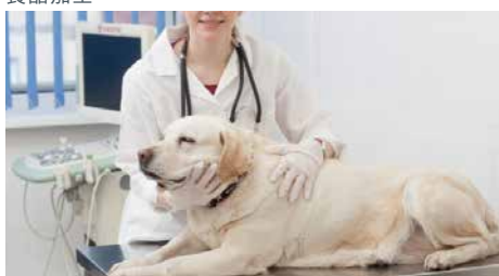
動物醫院、寵物店、飼養員