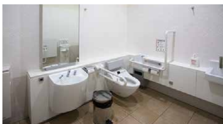
洗手間、污物處理室